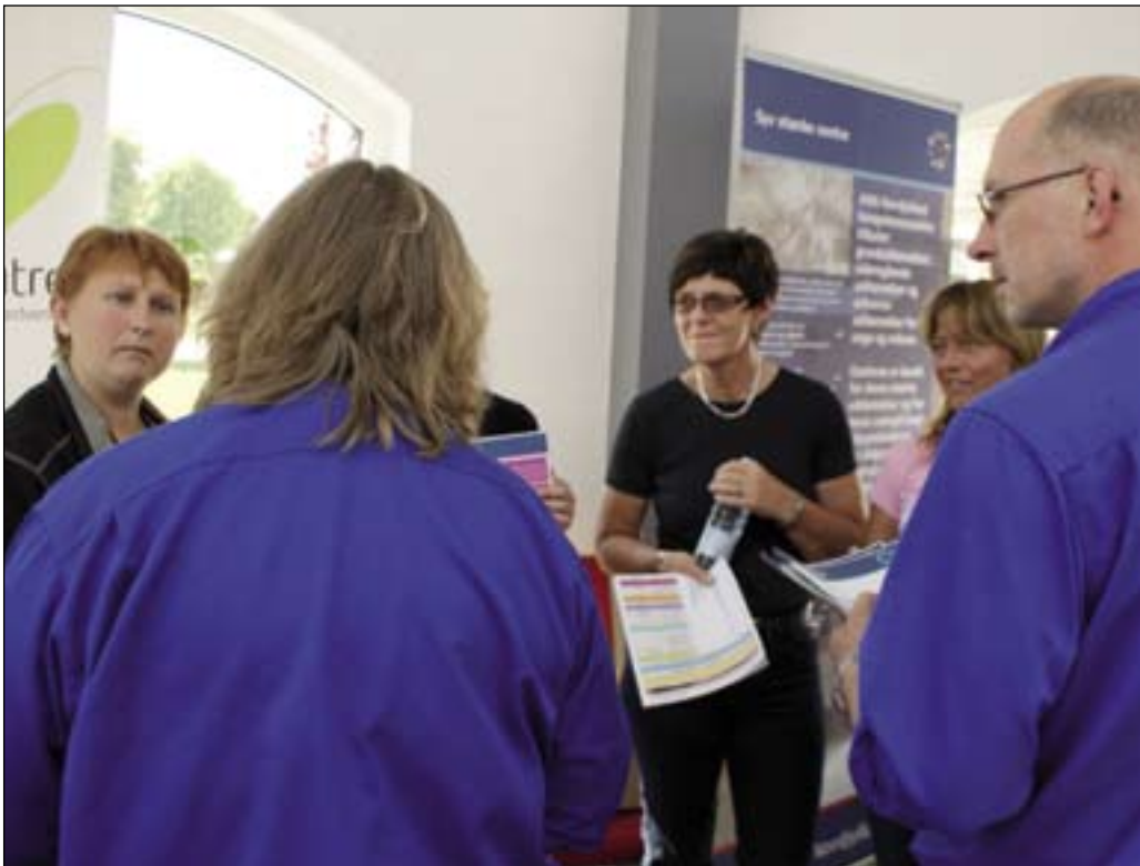
Fyrede medarbejdere hos RBM kunne få informationer om uddannelse og støtte, da der blev holdt uddannelsesmesse på virksomheden.

Virksomheden, der tidligere hed Rabami, blev i 2006 sammen med den svenske kontorstolefabrik RH Form købt af kapitalfondens Ratos.