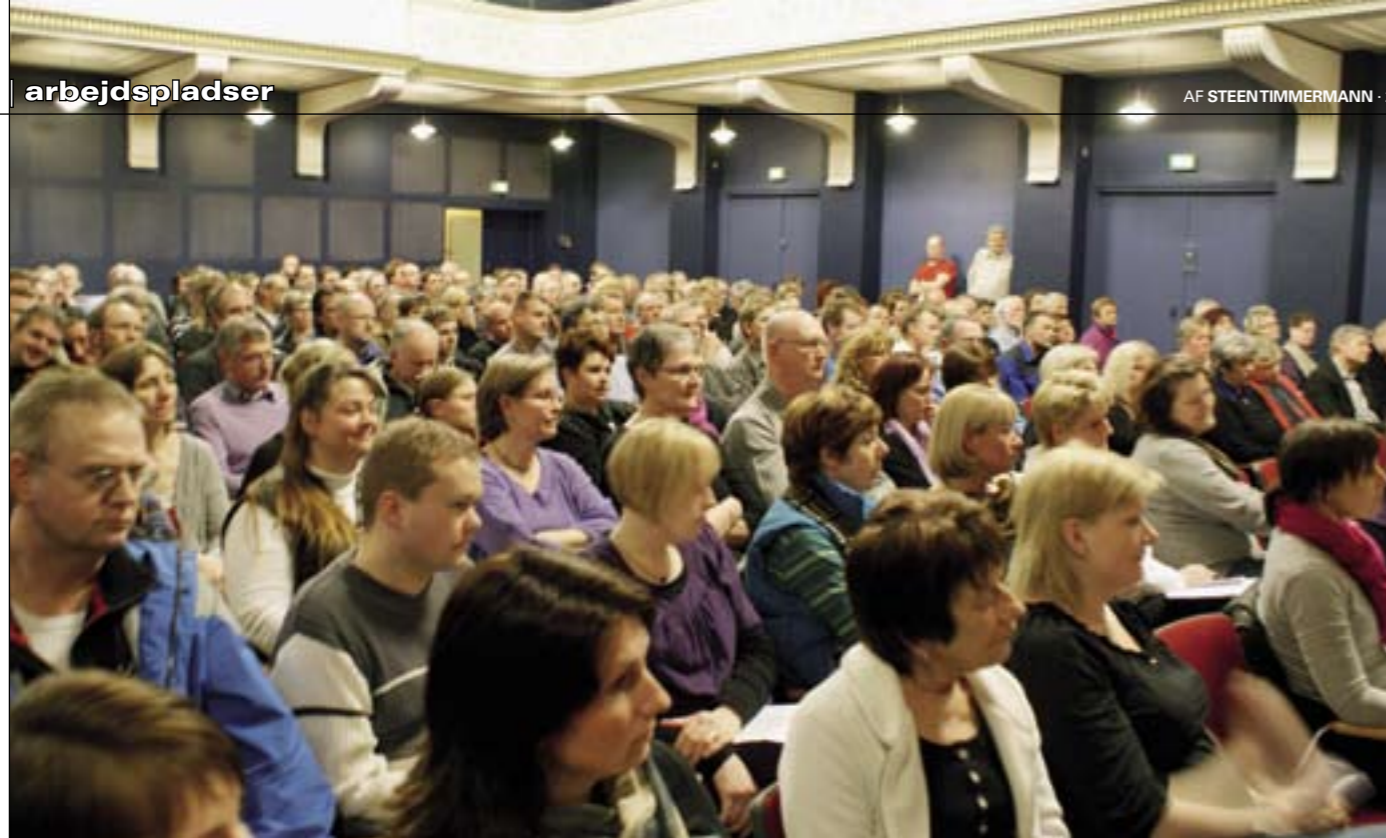
210 ansatte fra landsdelens forsvarsarbejdspladser sendte et klart signal til nordjyske folketingsmedlemmer.