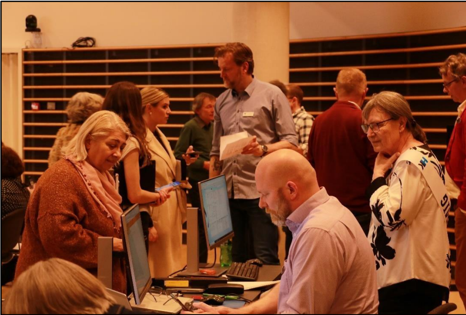
Den i virkeligheden eneste udfordring på det velbesøgte møde var at få afstemningssystemet til at virke.

- Det er på medlemsmøderne, jeg får en god viden om, hvad der sker på arbejdspladserne. Den viden anvender jeg i de forskellige mødefora, hvor jeg repræsenterer HK Stat Hovedstaden.