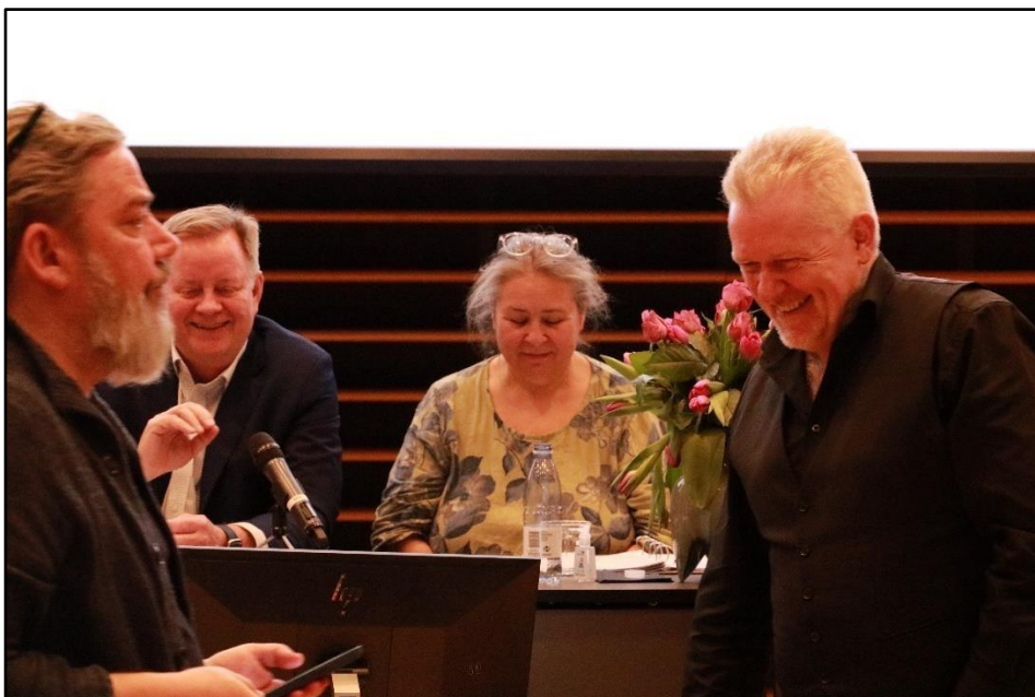
Generalforsamlingen var præget af smil på læberne, gode debatter og bred enighed om den faglige linje.

Debatten om hjemmearbejde har fyldt meget under hele coronaperioden, og den fortsætter. Senest er vilkårene blevet forringet, fordi der nu skal arbejdes mere end 2 dage hjemme om ugen, før arbejdsgiveren kan gøres ansvarlig. Nogle medlemmer er meget glade for muligheden, og for andre er det forfærdeligt.