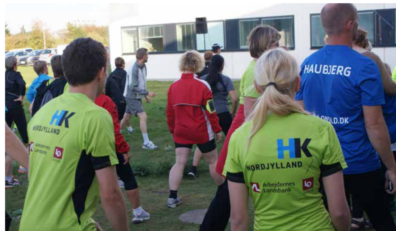
HK-løbet er en fast del af HK Nordjyllands sundhedsuge, der hvert år tiltrækker flere hundrede nordjyske HK-medlemmer til aktiviteter og foredrag.

Formålet med RIPU er at styrke det regionale samarbejde mellem industrivirksomheder og fagbevægelse om bl.a. beskæftigelse, infrastruktur og uddannelse i landsdelen.