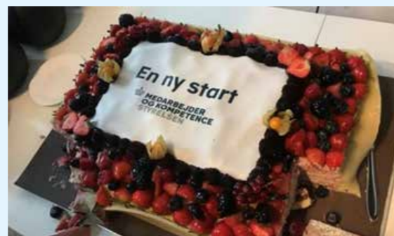
Tilblivelsen af Medarbejder- og Kompetencestyrelsen blev festligholdt ved en intern fejring den 27. september 2019.

enheden er flyttet til Skatteministeriet, er der lagt op til en adskillelse af statens økonomi og overenskomstforhandlingerne på det offentlige område. Det er et skridt på vejen til at få bedre balance i de offentlige overenskomster og dermed mere armlængde.