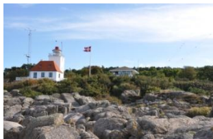
KUS Hamme Odde