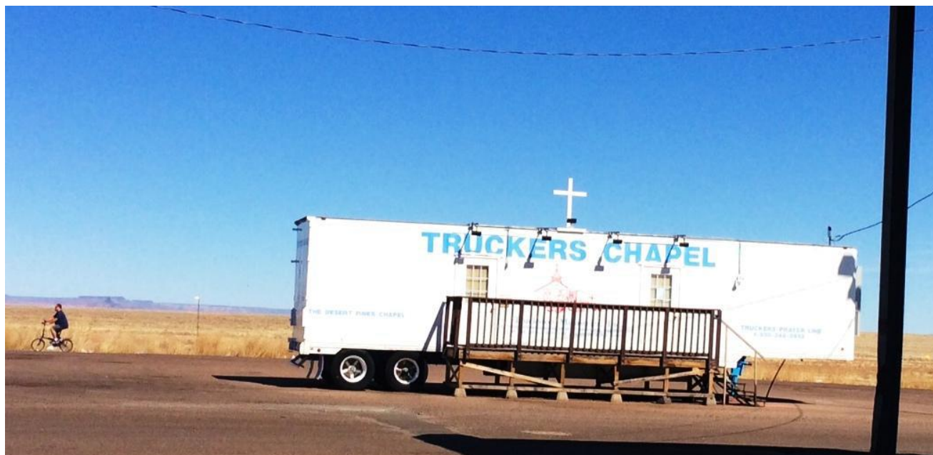
Truckers Chapel: Kirkerum for lastbilchauffører.

På en rasteplads et sted mellem Las Vegas og Denver (USA) er der også tænkt på de chauffører, der har brug for andet end chips, burger og cola.